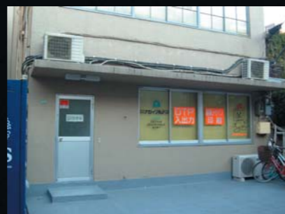
グラフィックコミュニケーションズセンター